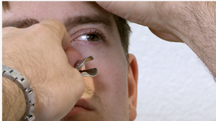
Video: Untersuchung Nase (15:10)