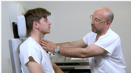
Video: Untersuchung Hals (10:15)