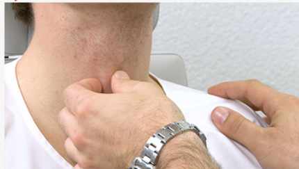
Video: Untersuchung Larynx (10:48)