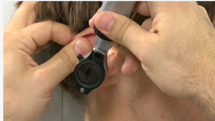
Video: Untersuchung Ohr (19:12)